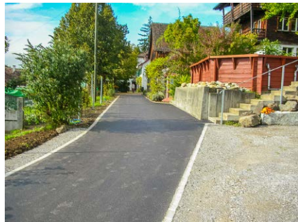
Zufahrt, Heim, Herrliberg