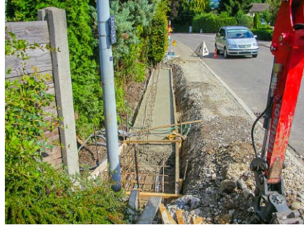
Mauerfundament, Privat, Egg