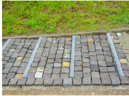
Treppenpflasterung, Politische Gemeinde Männedorf