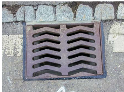
Schachtdeckel, Politische Gemeinde Erlenbach