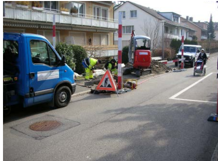
Wasserleitungsbruch, Werke am Zürichsee, Zollikerberg