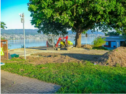
Gartengestaltung, Martin Stiftung, Erlenbach