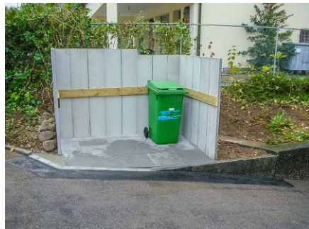
Containerplatz, Privat, Herrliberg