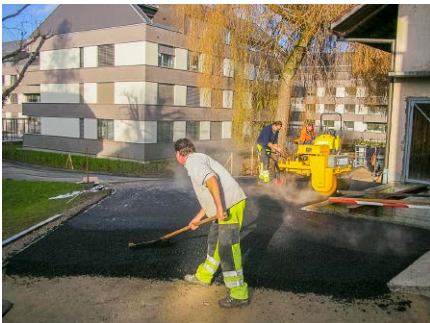
Zufahrt, Privat, Egg