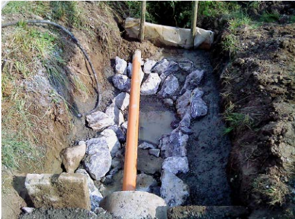
Bacheinlass, Politische Gemeinde Oetwil am See