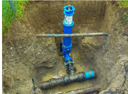
Hydrant-Neuerstellung, Werke am Zürichsee, Zollikon