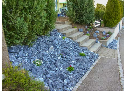
Vorgarten-Rabatte, Privat, Oetwil am See