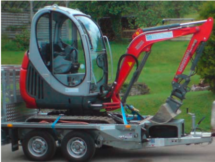
Rp. Bagger 2.0 To, mit Powertilt