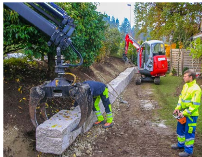
Gartenneubau, Privat, Egg