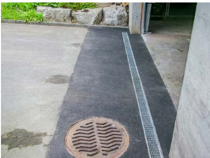
Rinnenreparatur, Privat, Kloten