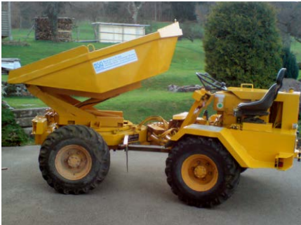
Dumper Allrad, 2,0 m 3