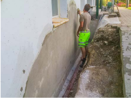
Mauersanierung, Privat, Egg