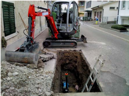
Wasserleitungsbruch, Werke am Zürichsee, Küsnacht