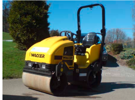
Vibro Walze 2 To