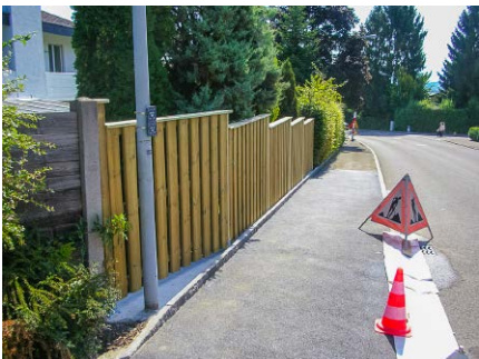
Sichtschutzwand, Privat, Egg