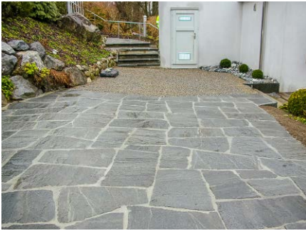
Gartensitzplatz, Privat, Egg