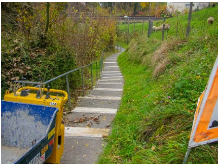
Belag Fussweg, Politische Gemeinde Erlenbach